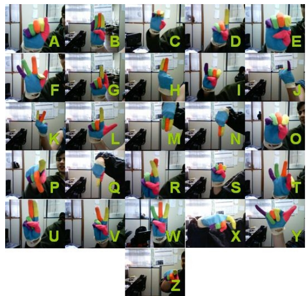
Figura 3. Alfabeto de Posturas em LIBRAS

A Fig. 3 mostra as 26 posturas utilizadas do alfabeto da Língua Brasileira dos Sinais (LIBRAS). Deve-se notar que as letras J, K, X e Z usam movimento da mão em sua representação. Para classificar estes movimentos como somente posturas estáticas, considera-se somente a postura final de cada gesto.