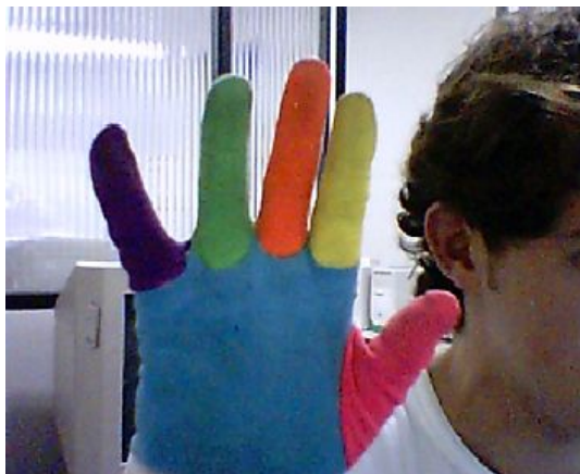
Figura 2. A luva colorida usada neste trabalho

A fim de diminuir o esforço computacional da etapa de localização e rastreamento das mãos, usamos uma luva colorida, onde cada dedo possui uma cor diferente, apresentada na Fig. 2. Tal método foi testado e aprovado por diversos pesquisadores [Abe 2000][Bray 2002][Stamer 1995]. O uso de uma luva colorida permite uma detecção e modelagem mais rápida das posturas dos dedos do que sistemas que utilizem imagens da mão livre, que necessitam um estágio complexo de detecção de cor de pele e segmentação dos dedos [Wysoski 2002]. Cada módulo da Fig. 1 é brevemente explicado a seguir.